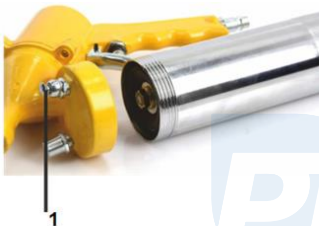
1. Vetrací otvor

6. Pomocou ventilu uvoľnite vzduchový vankúš vytvorený medzi mazivom a nástavcom. Nevypustenie zabráni fungovaniu maznice!